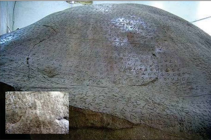
1.2 અશોકનો શિલાલેખ

સાંસ્કૃતિક, પૌરાણિક અને પુરાતત્વીય મહત્વ ધરાવતાં સ્થળોમાં લોથલ (ધોળકા તાલુકો), રંગપુર (લીમડી તાલુકો, સુરેન્દ્રનગર જિલ્લો), ધોળાવીરા (કચ્છ જિલ્લો), રોઝડી અથવા શ્રીનાથગઢ (રાજકોટ જિલ્લો) વગેરે મુખ્ય છે. વડનગરનું