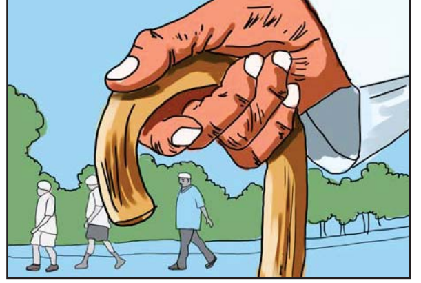
21.4 વૃદ્ધોને સહાય

ભારતમાં આરોગ્ય વિષયક સેવાઓ, અદ્યતન તબીબી સારવાર, ઔષધીય સવલતોના કારણે વ્યક્તિના સરેરાશ આયુષ્યમાં આજે સરેરાશ 4.3 વર્ષમાં વધારો થયો છે. 2001 થી 2005 ના સમયગાળામાં ભારતમાં પ્રજાનું સરેરાશ આયુષ્ય 63.2 વર્ષનું હતું, જ્યારે 2015માં વધીને સરેરાશ આયુષ્ય 67.5 વર્ષનું થયું છે. ભારતમાં 2001-2011 ના એક દાયકામાં વૃદ્ધોની સંખ્યામાં 2.75 કરોડનો વધારો થયો છે. 2011માં એક અંદાજ મુજબ વૃદ્ધ મહિલાઓની સંખ્યા 5.28 કરોડ હતી, જ્યારે પુરુષ વૃદ્ધોની સંખ્યા 5.11 કરોડની હતી. ભારતમાં સૌથી વધુ વૃદ્ધોની વસ્તી કેરાલા અને સૌથી ઓછી સંખ્યા અરુણાચલમાં છે. ગુજરાતમાં વૃદ્ધોની સંખ્યા અંદાજે 35 લાખથી વધુ છે. વૃદ્ધોની વધતી વસતી અને તેમનાં સરેરાશ આયુષ્યમાં વધારો થવાથી સામાજિક અને શારીરિક સમસ્યાઓ જન્મ લઈ રહી છે.