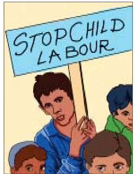
21.3 બાળમજૂરી અટકાવો

(અ) 14 વર્ષથી ઓછી વયના બાળકને કોઈ કારખાનામાં કે કોઈપણ કામ-ધંધામાં કે વ્યવસાયમાં નોકરીએ રાખી શકાશે નહિ. આના ભંગ બદલ નોકરીદાતા સામે કાનૂની રાહે પગલાં ભરીને સજા કરાવી શકાય છે. (બ) બાળપણમાં કે કિશોરાવસ્થામાં તેનું કોઈપણ પ્રકારે શોષણ ન થાય તથા તેને નૈતિક સુરક્ષા અને ભૌતિક સુવિધાથી વંચિત કરી શકાશે નહિ. (ક) બંધારણનો અમલ શરૂ થયાના 10 (દશ) વર્ષમાં 14 વર્ષની ઉંમર સુધીનાં તમામ બાળકોને મફત અને ફરજિયાત શિક્ષણનો પ્રબંધ સરકારે કરવાનો રહેશે. જોકે આ સંદર્ભે કેન્દ્ર